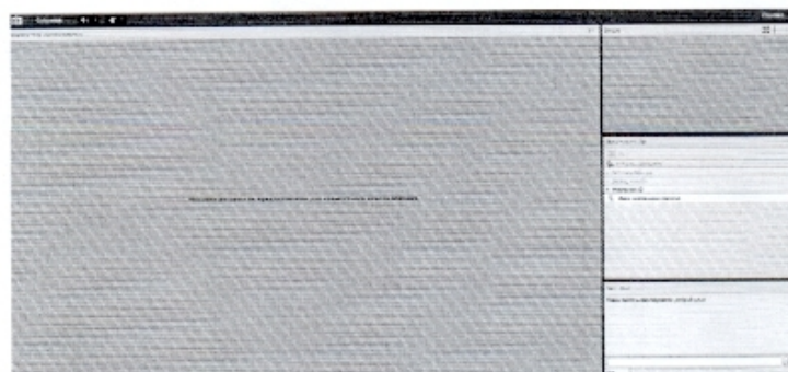
Рис. 2 Результат успешной авторизации

- нажмите кнопку «Войти в комнату» (если Вы первый раз участвуете в вебинаре, то система предложит установить Adobe Connect, необходимо согласиться на установку программного обеспечения).